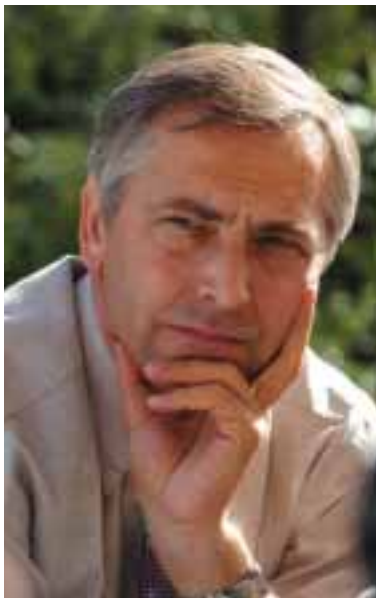
Ján Figel 1

In verband met deze problematiek hebben de Raad en het Europees Parlement eind 2006 een Europees kader van sleutelcompetenties voor een leven lang leren vastgesteld. In dit kader worden voor het eerst op Europees niveau de sleutelcompetenties vastgesteld en omschreven die de burgers nodig hebben voor zelfontplooiing, sociale integratie, actief burgerschap en inzetbaarheid in onze kennismaatschappij. Het initieel onderwijs en de initiële opleiding van de lidstaten moeten de ontwikkeling van deze sleutelcompetenties bij alle jongeren ondersteunen en de onderwijs-